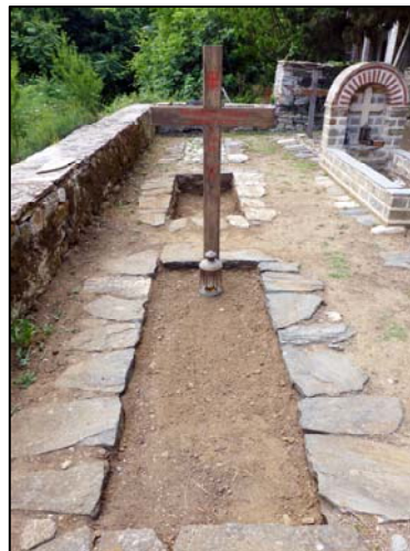
Ό άπέριττος, κατά τή μοναχική τάξη, τάφος του Γέροντα.

Στίς 4 Ιουνίου 2014, ήμέρα Τετάρτη, τό απόγευμα και σέ ήλικία 83 έτών ό μακαριστός Γέροντας Νικόδημος, « κρίμασι οίς οίδεν ό Κύριος », έκομήθη άπροσδόκητα μετά από άτύχημα στό Κελλί του στην Καψάλα Αγίου Όρους. Ό τρόπος του θανάτου του είχε παρόμοια χαρακτηριστικά μέ αυτόν του Όσίου Άθανασίου του Άθωνίτου, τον όποιο ιδιαιτέρως εύλαβείτο και του όποιου ύπήρξε βιογράφος, αλλά και έκδότης των εύρισκομένων Έργων του. Η έξόδιος Άκολουθία και ή ταφή έγιναν τήν έπομένη ήμέρα, 5 Ιουνίου, στην Ίερά Μονή Παντοκράτορος Αγίου Όρους, στην όποια ανήκε τό Κελλί του.